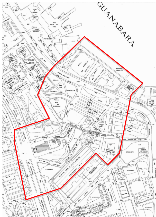
Ilust. 2 - Planta Cadastral com a área da Praça do Expedicionário e entorno em destaque. Planta fora de escala, 2000.